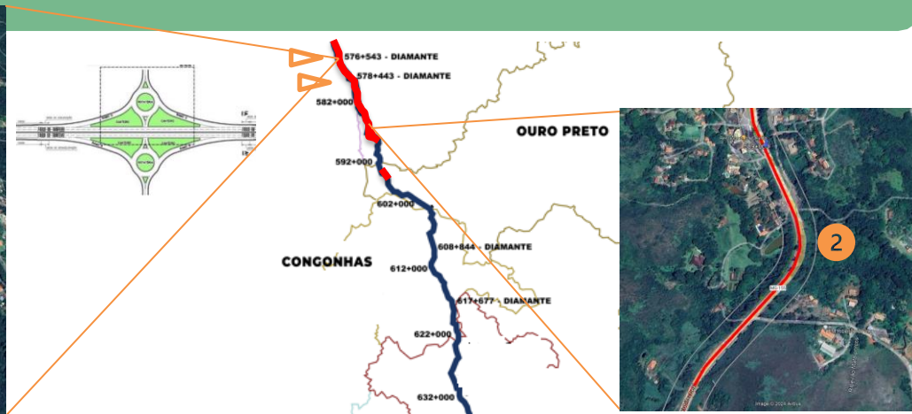
2 CURVA CELINHA BR040 – km 589,310 Duplicação Correção traçado