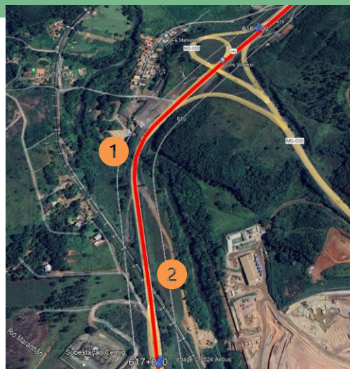
1 PONTE RIO MARANHÃO BR040 – km 615,4 Duplicação