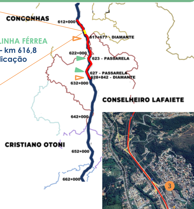
2 VIADUTO LINHA FÉRREA BR040 – km 616,8 Duplicação