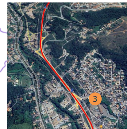
VIADUTO CONGONHAS BR040 – km 613,1 Duplicação