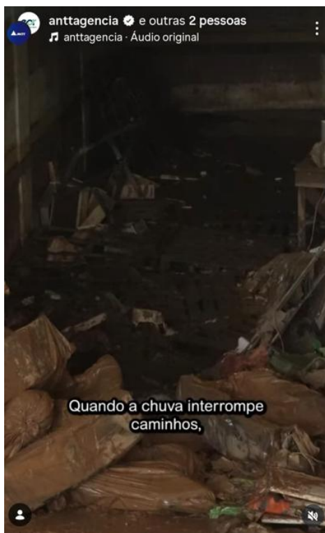
Figura 6: Post em collab com a ANTT sobre as chuvas que atingiram Juiz de Fora, Ubá e Ewbank da Câmara