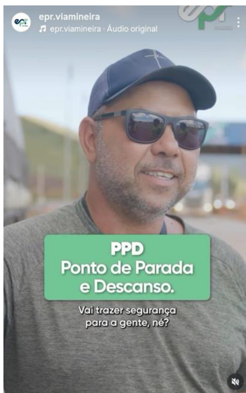
Figura 24: Post em vídeo com depoimento de um caminhoneiro sobre a importância de um ponto de parada e descanso