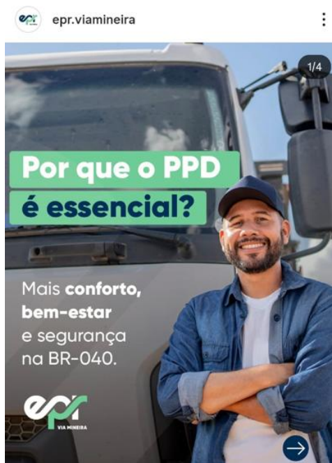
Figura 3: Post sobre o ponto de parada e descanso para caminhoneiros

Aproveitamos para lembrar que já está disponível no site da Concessionária o Informativo Mensal da EPR Via Mineira, reunindo os principais destaques e conteúdos de março.