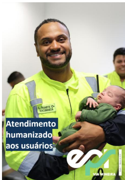
Figura 29: Capa do informativo mensal disponível no site da Concessionária.