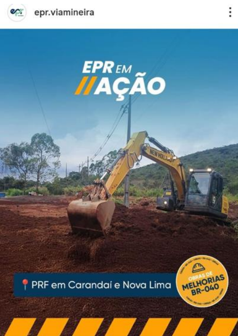
Figura 5: Post sobre a reforma da PRF de Carandaí