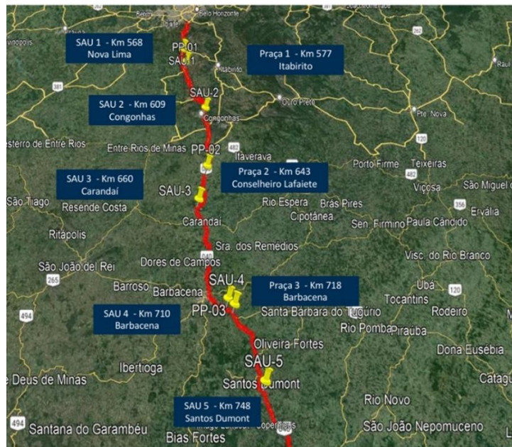
Figura 2: localização das edificações e instalações operacionais.

A concessão conta com 05 (cinco) bases operacionais e 03 (três) praças de pedágio distribuídos ao longo do trecho concedido. A imagem de satélite da Figura 2 mostra a localização dessas edificações operacionais.