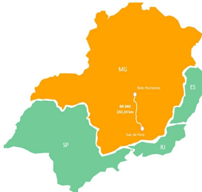
Figura 1: ilustração da localização do trecho concedido em MG.

parâmetros técnicos e de segurança mínimos aos usuários da rodovia no trecho sob concessão. O trecho concedido está localizado no Estado de Minas Gerais (MG), conforme ilustração na Figura 1.