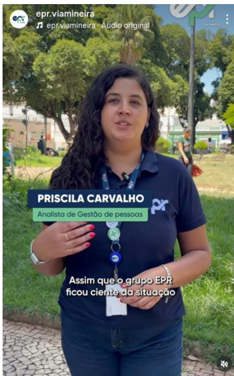
Figura 7: Post sobre a entrega das doações aos municípios de Juiz de Fora, Ubá e Ewbank da Câmara