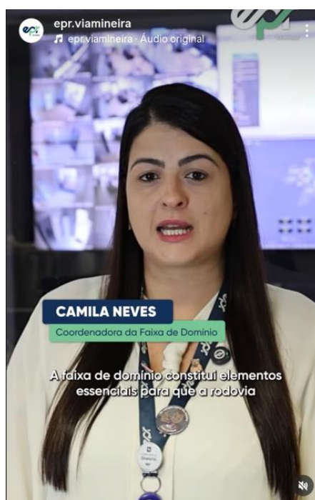
Figura 85: Post em vídeo sobre a faixa de domínio