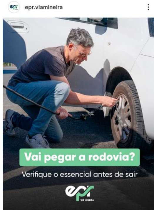
Figura 96: Post com dicas de segurança para quem vai pegar a rodovia