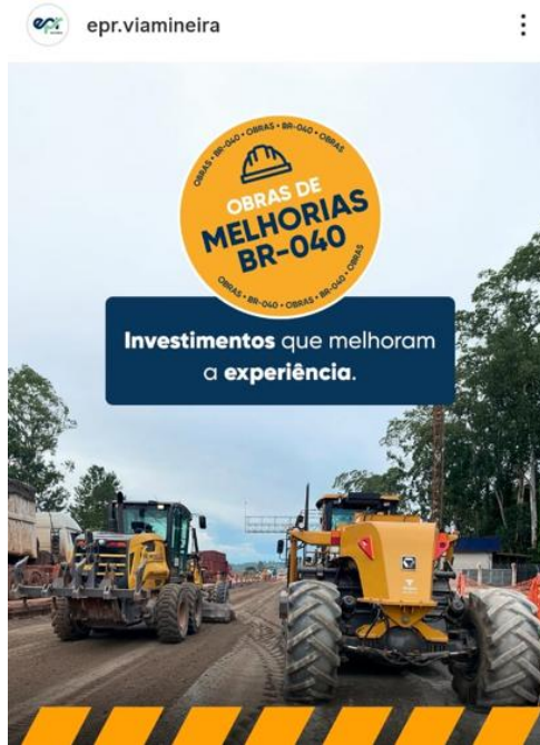
Figura 4: Post sobre as melhorias implantadas na BR-040