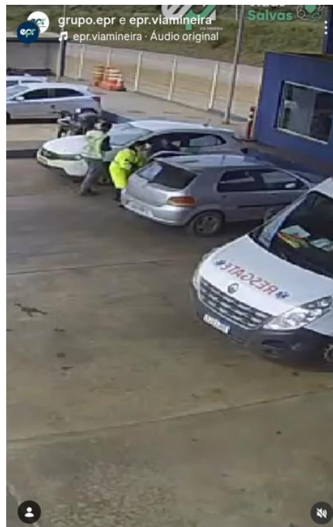
Figura 107: Post em vídeo sobre um parto realizado na 040